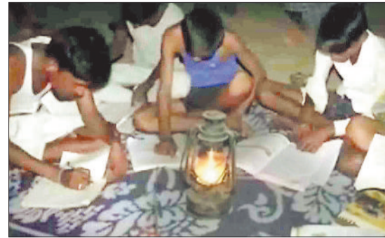
लाटन व ढिबरी की रेशनी में पढ़ाई करते बच्चे।

आधुनिक युग में जब गांव-गांव में तकनीकी विकास हो रहा है तथा रोजगार के नए-नए अवसर पैदा हो रहे हैं वीडियो के बीच बसे लगभग दो दर्जन गांव के लोगों की जिंदगी ढिबरी के भरोसे चल रही है। विद्युत के अभाव में क्षेत्र के गांवों में अभी तक आटा चक्की एवं धान कुटने की मशीन तक नहीं पाई है तथा लोगों को छोटी-छोटी जरूरतों के लिए लम्बी दूरी का सफर करना पड़ता है। गांव को बिजली से रेशन होने का सपना देखने वाले पीढ़ी की नजरें धुंधली हो गई लेकिन गांवों तक बिजली नहीं पहुंच सकी। क्षेत्रवासियों के लिए विद्युत विस्तार के महत्व का अंदाजा इसी बात से लगाया जा सकता है कि विधानसभा चुनाव की प्रक्रिया प्रारम्भ होते ही राजनीतिक दबाव में विद्युत